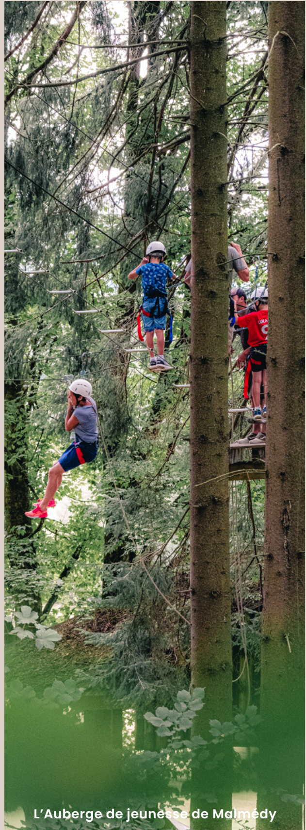
L'Auberge de jeunesse de Malmédy

COORDINATRICE DU PROJET ARDENNE ECOTOURISM