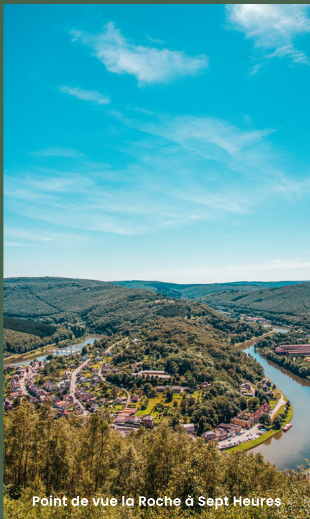
Point de vue la Roche à Sept Heures

Le paysage des Hautes Fagnes est rythmé par ses caillebotis en bois et ses sapinières emblématiques. Ses paysages de landes et de tourbières évoquent les contrées nordiques.