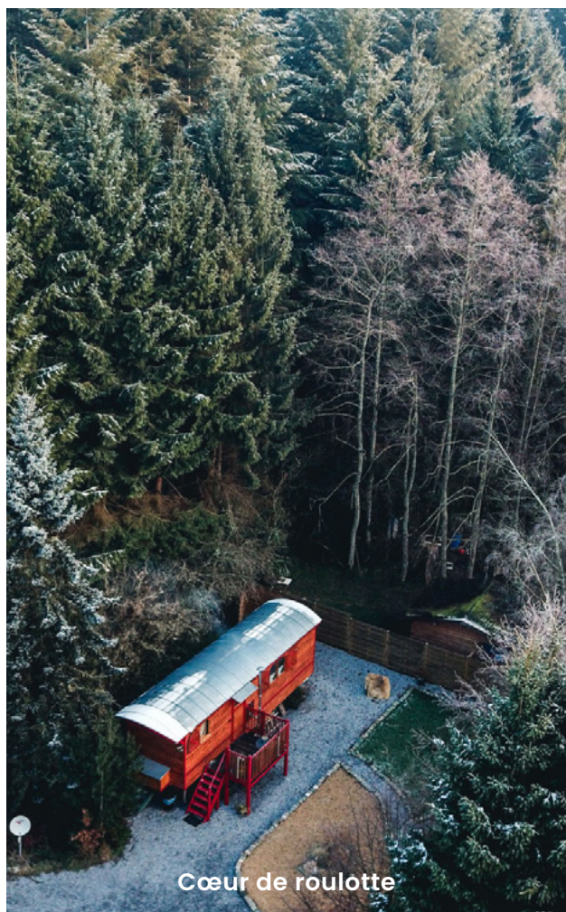
Cœur de roulotte