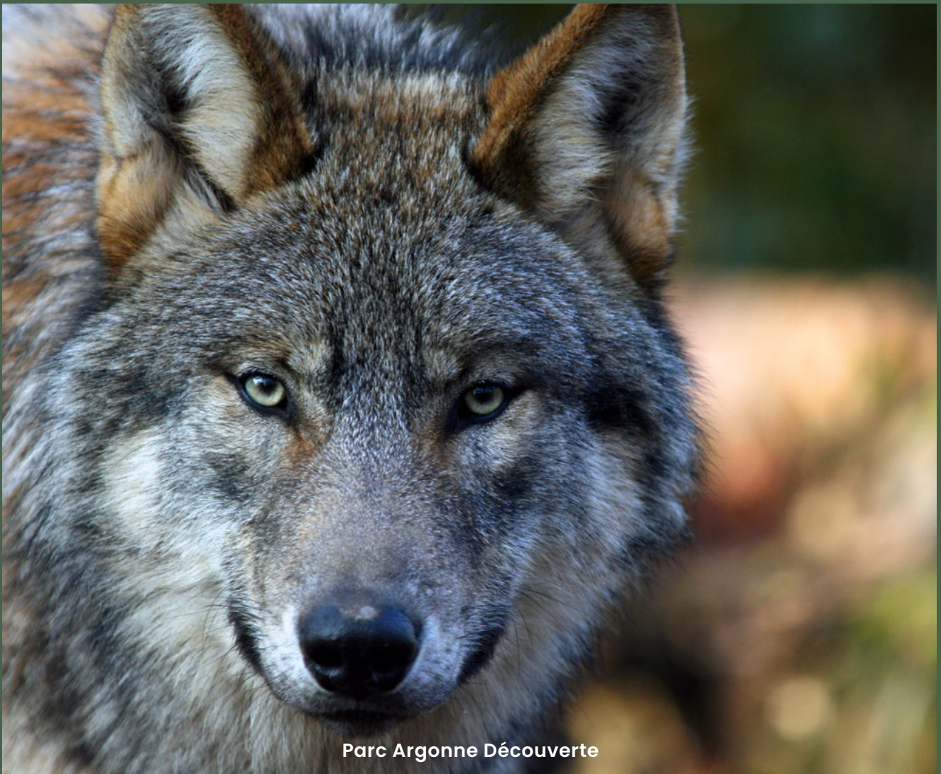
Parc Argonne Découverte