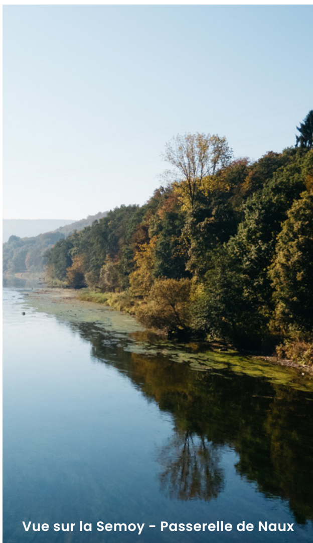
Vue sur la Semois – Passerelle de Naux