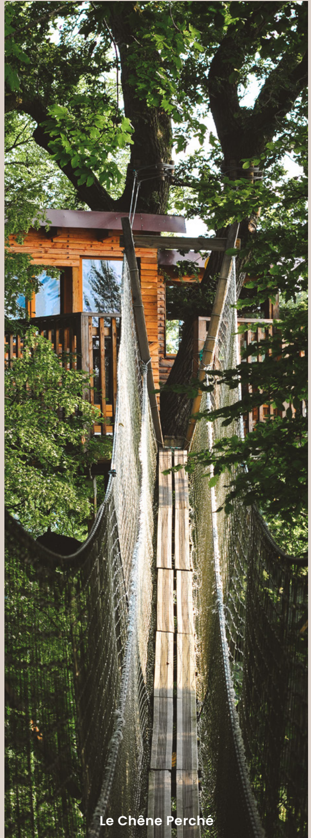
Le Chêne Perché