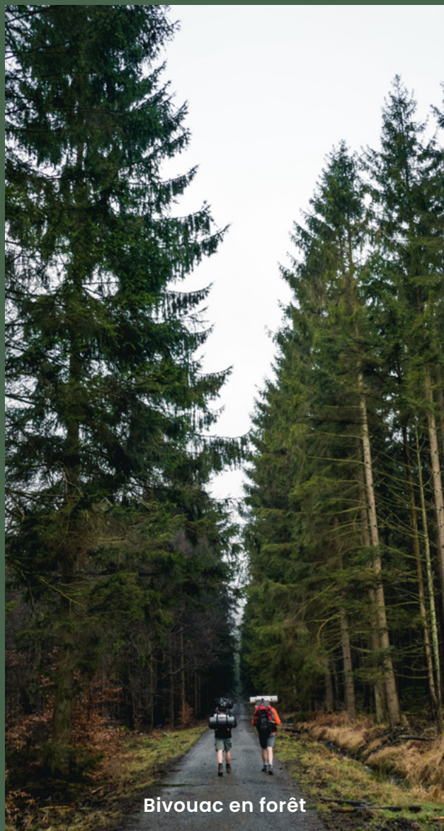
Bivouac en forêt