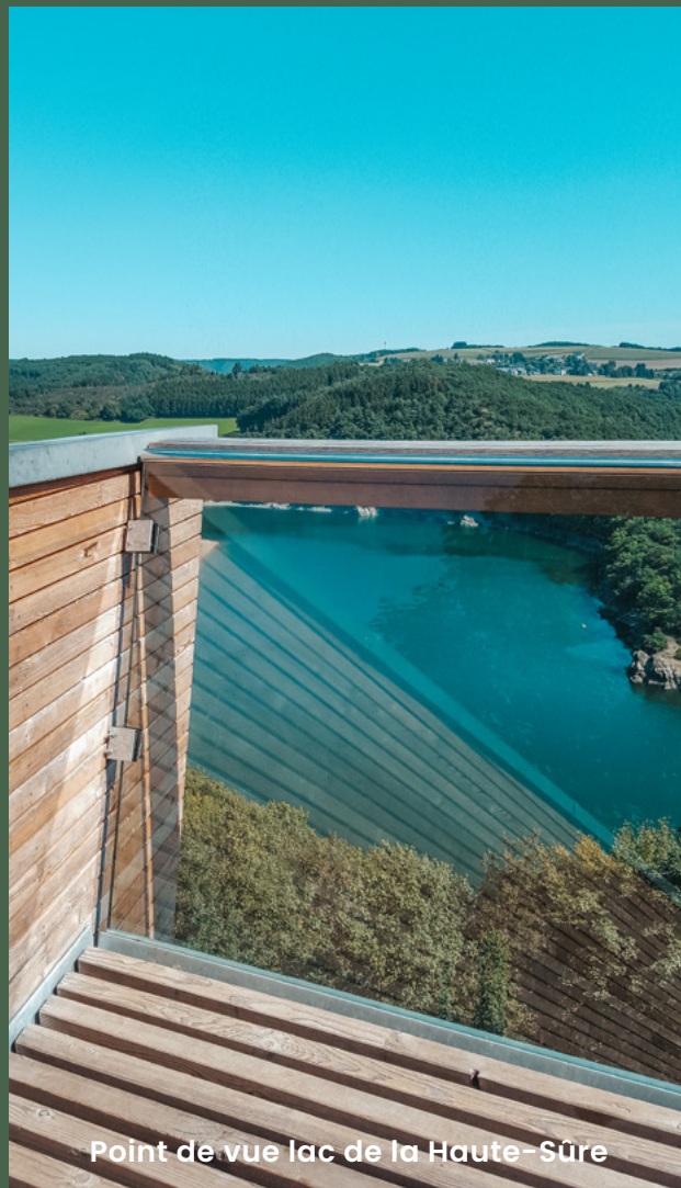
Point de vue lac de la Haute-Sûre