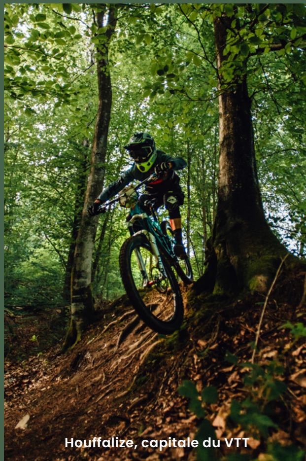
Houffalize, capitale du VTT