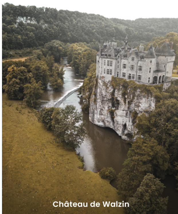
Château de Walzin

Alliant force, merveilleux et quiétude, l'Ardenne est un havre de verdure qui comprend plusieurs grands massifs forestiers comme ceux de Saint-Hubert, de la Semois et d'Anlier, et pas moins de 10 parcs naturels avec d'immenses espaces protégés pour se promener pendant des heures en totale déconnexion.